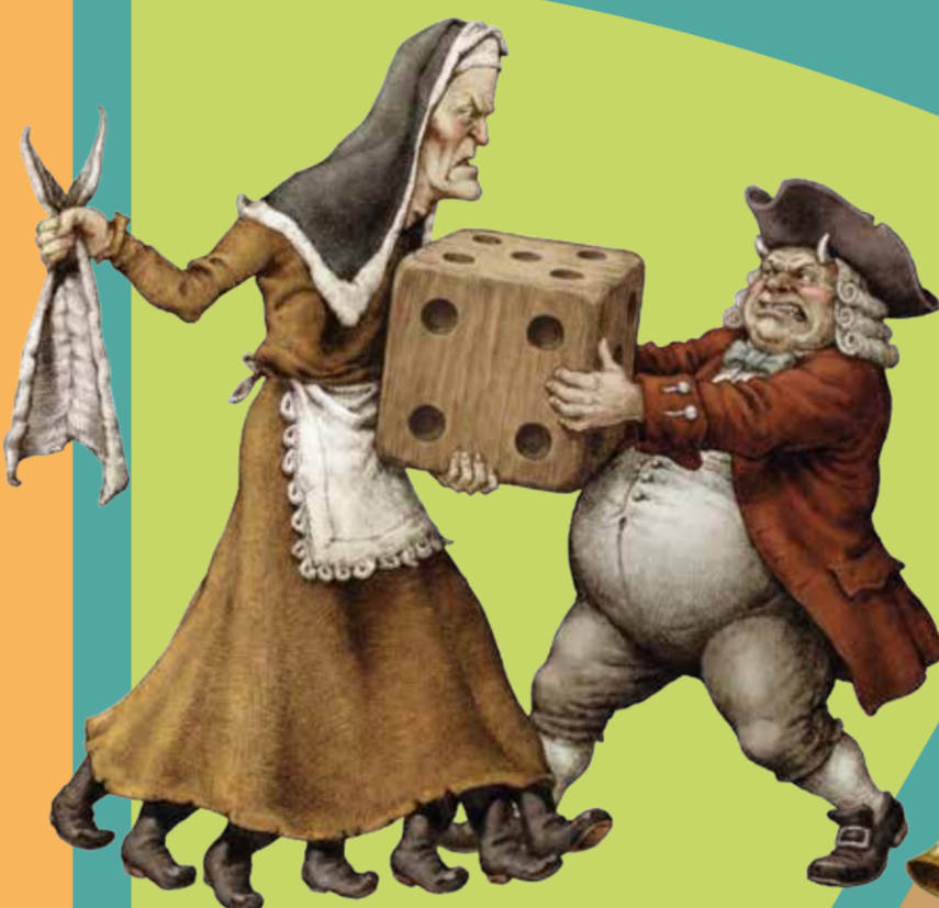
DON CARNAL Y DONA CUARESMA