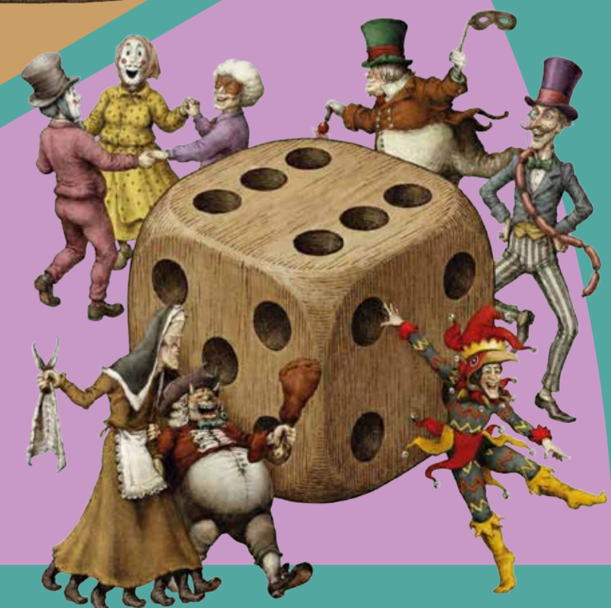
EL SEÑOR TU PERSONAJE