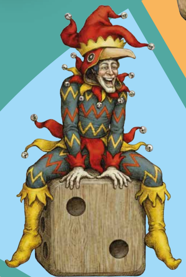
REY DE GALLOS